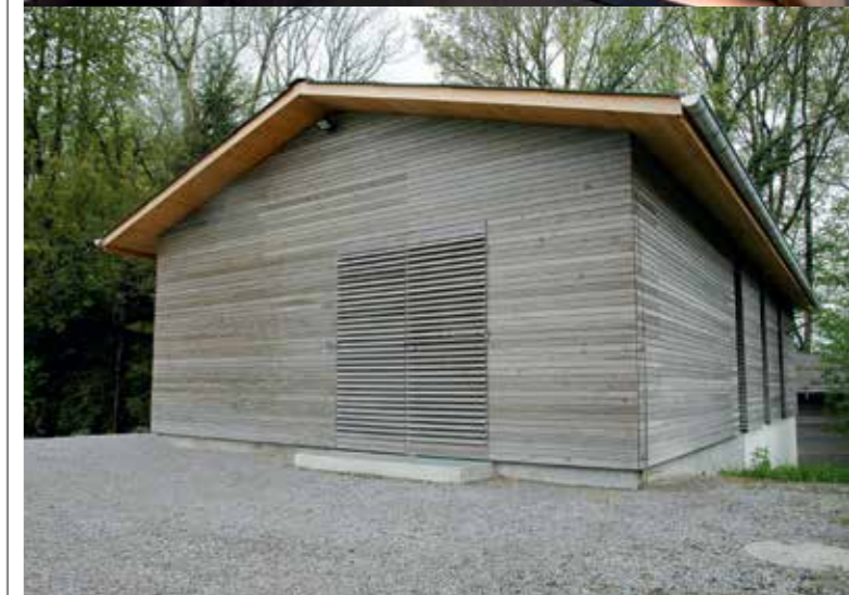
Aus zwei alten Baracken ist ein Wohnhaus erster Güte entstanden. Die einfache, unauffällige äussere Erscheinung musste Bauzonen-technisch beibehalten werden, ebenso die Holzkonstruktion im neuen Wohnbereich, der nach dem Minergie-Standard von einer Pelletsheizung und Solarzellen beheizt wird.

— VÖLLIG UNSCHENBAR liegt es vor mir, das Haus auf dem Horgenberg, das früher einmal nicht mehr als eine schlecht beheizbare Notunterkunft war. Wer auf dem Wanderweg, der am Einfamilienhaus vorbeiführt, läuft, merkt auf den ersten Blick gar nicht, dass sich hinter der scheinbar fensterlosen Fassade aus grauen Holzlatten ein modernes Wohnhaus befindet. Das hat natürlich auch damit zu tun, dass an dieser Stelle am Waldrand eigentlich gar kein Wohnhaus erwartet wird. Die Lage scheint alles andere als Bauzone zu sein. Tatsächlich ist es nur möglich, hier in der Landwirtschaftszone zu wohnen, weil dies beim Bau der ursprünglich hier gestandenen Baracken schon vorgesehen und die Umnutzung an strenge Auflagen gebunden war.